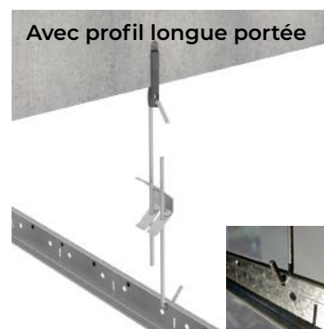
Avec profil longue portée

Insérer le crochet dans un cavalier. Puis clipser le tout dans la fourrure.